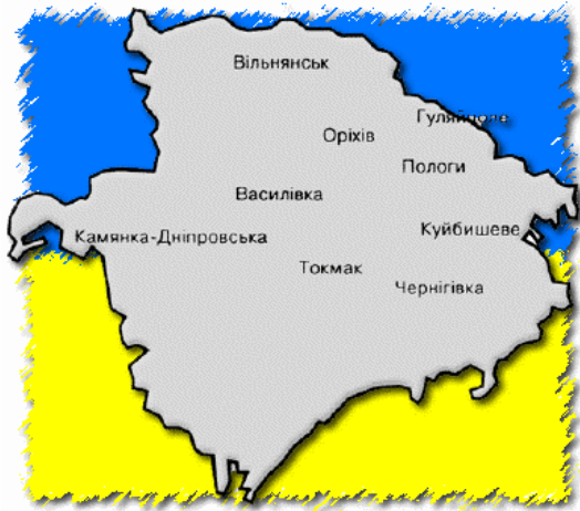
Рисунок 1.1 – Географія поширення газети “Запорізька правда” (найбільша кількість читачів)

Якщо невеликий рисунок, схема, формула (не перевищує \frac{1}{4} сторінки) уводиться до тексту як елемент увиразнення чи посилення розуміння, то між ним і основним тестом має бути відстань у 2 інтервали.